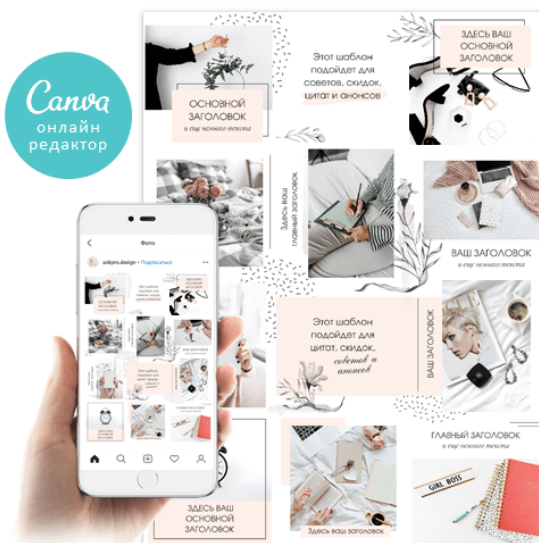
Шаблоны для социальных сетей