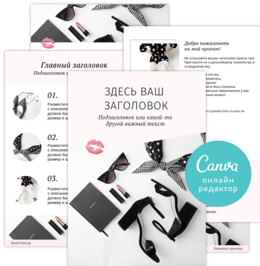
Шаблоны для создания чек-листов

Продвигайте свои проекты проще и быстрее, используя готовые шаблоны. Для занятых девушек-предпринимателей, тренеров, коучей, блогеров