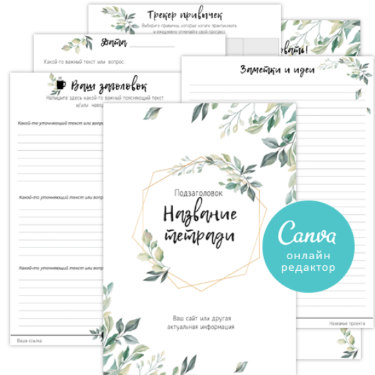
Шаблоны тетрадей и дневников